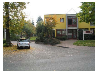
Einfahrt zur Tiefgarage